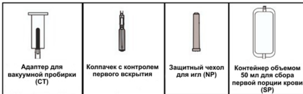
Рис. 1 КОМПОНЕНТЫ СИСТЕМЫ